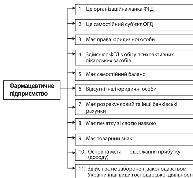
Рис. 1. Основні риси фармацевтичного підприємства

Основні риси фармацевтичного підприємства (ФП), яке здійснює обіг лікарських засобів із психоактивними властивостями, наведено на рис. 1.