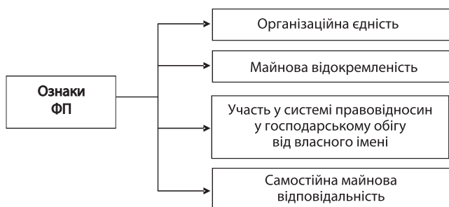
Рис. 3. Ознаки фармацевтичного підприємства як юридичної особи

4) самостійна майнова відповідальність. Через те, що ФП здобуває від свого імені права та обов'язки, воно повинно нести пов'язані з цим обов'язки та відповідальність.