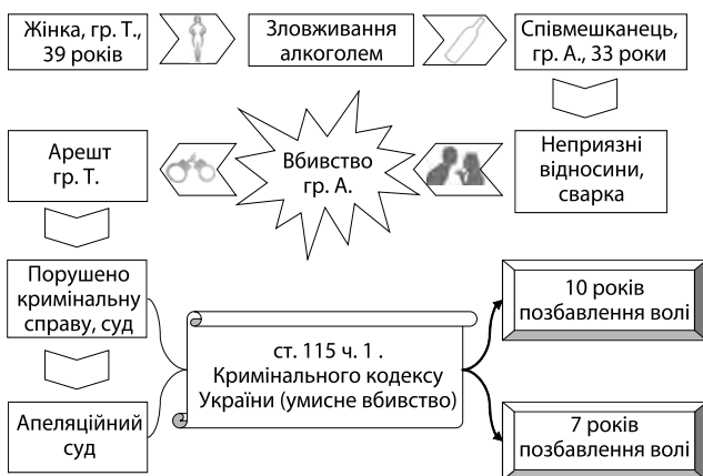
Рис. 3. Кримінальні наслідки зловживання алкоголем

Приклад із судово-фармацевтичної практики. У грудні 2012 р., згідно з вироком Апеляційного суду Закарпатської області, до 7 років позбавлення волі засуджено 39-річну жінку гр. Т., оскільки вона, перебуваючи в стані алкогольного сп'яніння, забила до смерті свого 33-річного співмешканця гр. А. В ході досудового слідства було встановлено, що жінка гр. Т. у стані алкогольного сп'яніння посварилась зі своїм співмешканцем гр. А. та в результаті раптово виниклих неприязних відносин, забила його до смерті важким предметом (каменем). Щодо гр. Т. порушено кримінальну справу за ст. 115 ч. 1 Кримінального кодексу України (умисне вбивство). Гр. Т. свою вину у скоєному не заперечувала. Судом гр. Т. було засуджено до 10 років позбавлення волі, проте Апеляційний суд Закарпатської області змінив рішення суду першої інстанції на 7 років позбавлення волі [10].