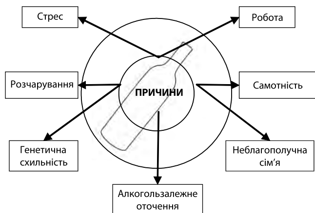
Рис. 1. Причини початку зловживання алкоголем серед жінок

Дані Міністерства молоді та спорту України свідчать, що алкогольна залежність частіше спостерігається у жінок молодого віку (до 25 років), вдвічі частіше — у жінок, які живуть у південно-східному регіоні, у жінок з вищою освітою, з добрим матеріальним становищем і неодружених [5].