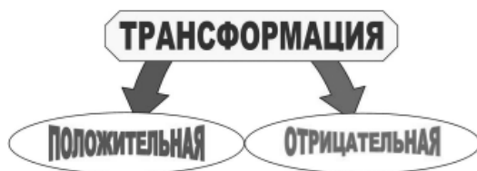
Рис. 1. Варианты трансформации эпилептических припадков

Понятие трансформация (эволюция) эпилептического припадков нами было определено как видоизменение клинической формы припадков, которое может указывать на ухудшение и прогрессирование заболевания («отрицательная» трансформация) или может свидетельствовать об улучшении течения болезни («положительная» трансформация) (рис. 1).