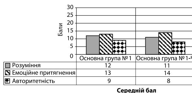
Рис. 1. Середній бал за окремими шкалами методики РЕА подружжя основної групи № 1

Детальний аналіз показників за окремими показниками партнерської взаємодії (рис. 1) довів, що за оцінкою середнього балу за шкалою розуміння у жінок та їх чоловіків основної групи № 1 в цілому відсутня картина відчуття розуміння особистості партнера та суб'єктивного відчуття його індивідуальних особливостей, поведінки, думок, почуттів і намірів. За результатами оцінки емоційного тяжіння встановлено, що частіше партнери «відштовхували» один одного із небажанням спілкуватися. Виявлений низький середній бал характеризував труднощі у спілкуванні та відчуття втоми один від одного. За шкалою авторитетності встановлено труднощі у сприйманні партнера як особистості та прийнятті його світогляду, інтересів, думок. Низький бал свідчив про неухвалене ставлення до партнера як до особистості.