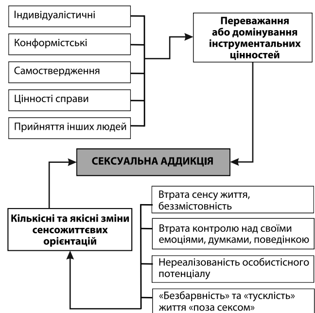
Рис. 3. Вплив зміни сенсожиттєвих орієнтацій та життєвих цінностей на формування сексуальної аддикції

На рис. 3 схематично відображено вплив зміни сенсожиттєвих орієнтацій та життєвих цінностей на формування СА.