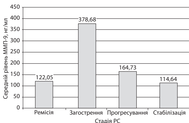
Рис. 2. Залежність рівня MMP-9 від стадії захворювання розсіяного склерозу (коефіцієнт F = 104,6 ; p < 0,0001 )

Найбільші значення рівня MMP-9 спостерігалися на стадіях активності патологічного процесу — загострення і прогресування. На стадіях ремісії і стабілізації рівень MMP-9 був у межах норми. Отже, виявлено, що середній рівень MMP-9 вірогідно залежить від стадії захворювання РС.